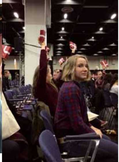
Konfis bei der Missionale 2016