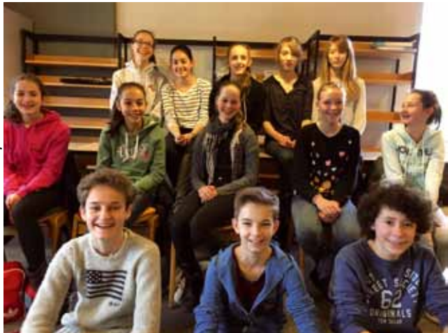
Die Konfirmanden 2017