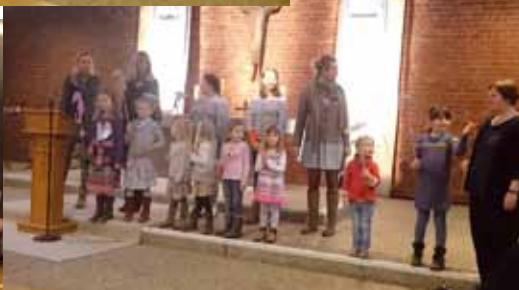
Kigo - Emil, der Fisch